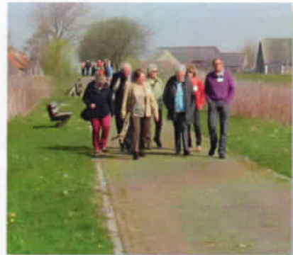
Wandelen op Tiengemeten