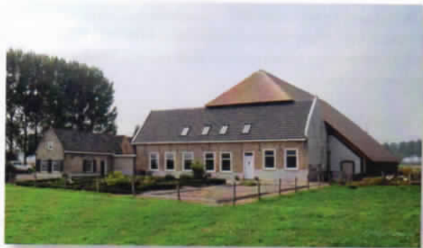
Hoeve Bouwlust na de brand