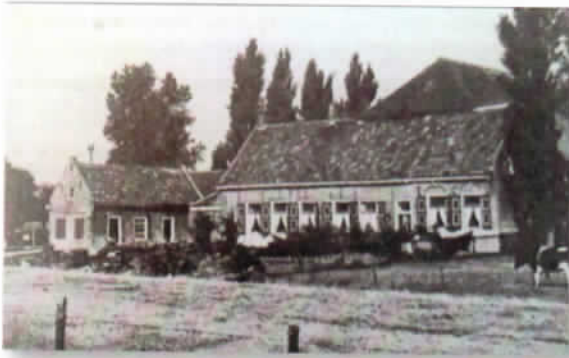
Hoeve Bouwlust voor de brand