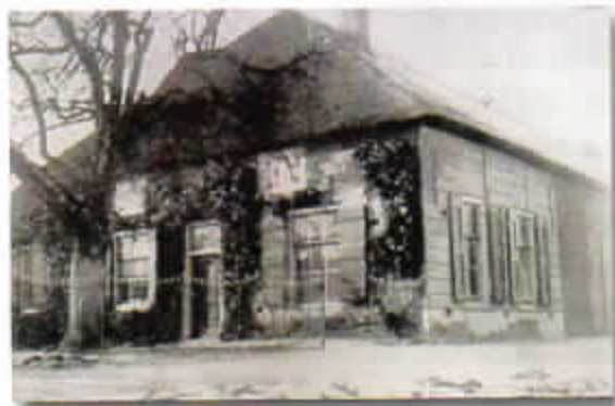
Oud dak 1924.

Tevens staan de foto's van de renovatie van boerderij te Dubbeldam op www.alloysehoeve.nl bij 'nieuws'. Schil Herweijer P. 769.