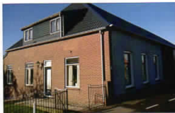
Nieuw dak 2013.