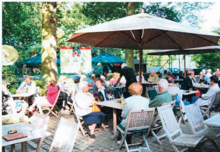
Nagenieten op het terras van 'Den Duiventoren'