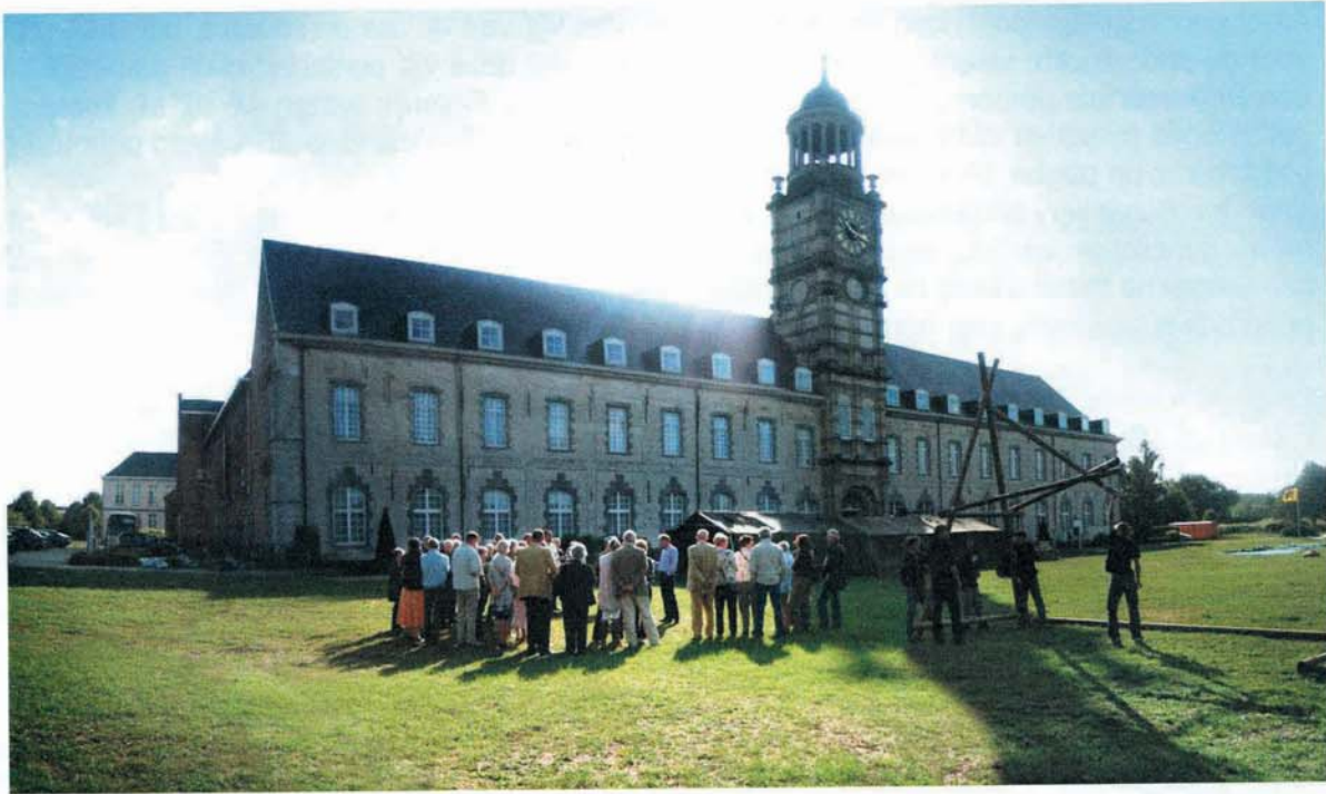
St. Bernardus Abdij te Hemiksem: onze eerste stop.

De klei op de rechteroever van de Rupel – zijrivier van de Schelde – is eigenlijk het 'goud' van deze verder arme streek. De klei ligt soms wel 30 meter diep en in de loop der eeuwen is er voortdurend klei afgegraven.