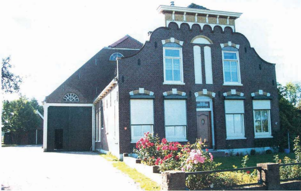
Hoeve Havenstraat 3 te Strijensas.