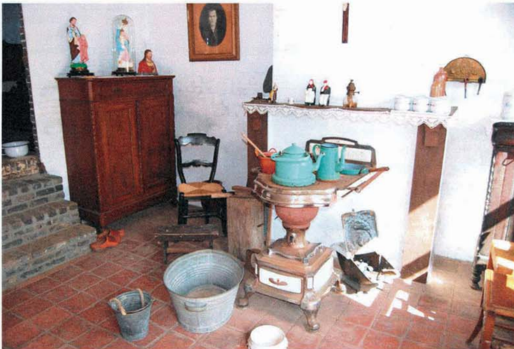
Arbeidershuisje bij de steenbakkerij

In de Sint Pieterskerk komen we de naam Herweijers tegen op een monument voor de gevallen uit de eerste wereldoorlog en in de kerk zelf vond in 1430 of eind 1429 de bekende 'Soending na dubbele manslag' plaats. Wat was het geval ?