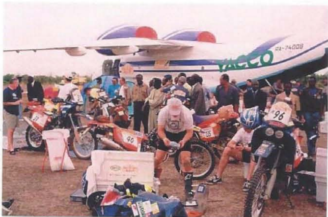
Reparaties en koepeltentjes onder de vleugels van het transportvliegtuig