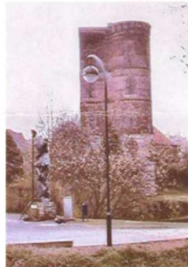
foto 1. Graventoren

Daarna gaan we naar Hemiksem, richting Antwerpen via A12 of N177, afslag Hemiksem, daarna in westelijke richting naar de Sint Bernardusabdij (foto 5) , vlakbij 3 windmolens en 2 torens bij de Schelde. Dit ligt tegen de plaats Schelle aan, onder Hemiksem. We brengen daar een bezoek aan deze abdij daterend uit ca. 1200. Deze is heel bijzonder en indrukwekkend, er is veel te zien. We brengen hier ruim 1 uur door. De oude kerk is reeds lang weg en stond op hetzelfde terrein. Momenteel worden er in de abdij appartementen gebouwd. Iedere 1 e zondag van de maand tussen 2-4 uur is de Heemkundige Kring open, er is heel veel geschiedenis over deze streek verkrijgbaar. We begrijpen dat hiervandaan het steenbakken is begonnen en oorspronkelijk door priesters is opgezet.