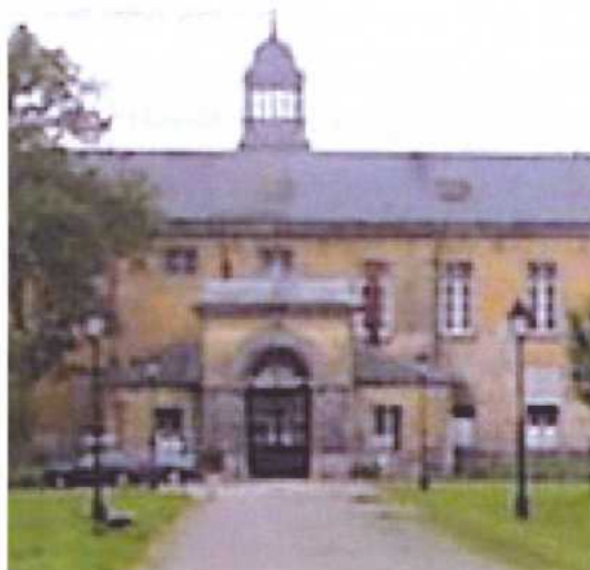
foto 4. St. Bernardusabdij

Afsluitend dineren we in Sint Niklaas, op de markt of in Kasteel Walburg. Ook het visrestaurant nabij Bazel is goed. Voldaan keren we na deze dag in de Hoeksche Waard terug en concluderen dat dit een prachtig gebied is, waar we zeker nog eens naar terug willen gaan, misschien later in groter gezelschap (excursie?). Misschien wilt u alvast eens gaan kijken of dit interessant genoeg is?