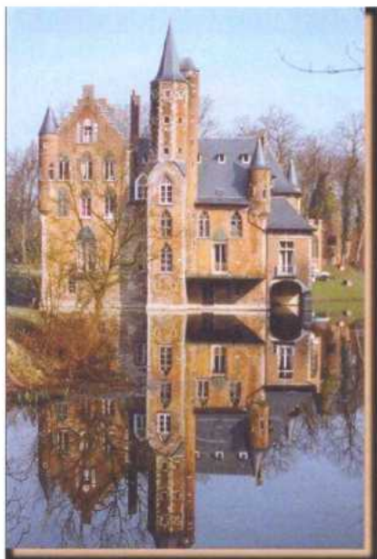
foto 1, kasteel Wissekerke

Waas zoals Belsele, Sint-Gillis en Vrasene (pag. 11 v.h. boek).